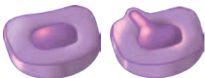
links: normale Bandscheibe, rechts: Vorfall

Eine weitere Möglichkeit der interventionellen Schmerztherapie bei kleinen, symptomatischen Bandscheibenvorfällen sind verschiedene Arten der minimalinvasiven Bandscheibendekompression. Dabei werden durch kleine Hautschnitte Instrumente in die Bandscheibe geführt und kleine